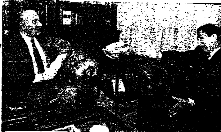
الرئيس الحسيني مع سفير اليمن الشمالي